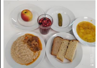
Бесплатное питание (12 лет и старше)