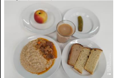
Обед (7-11 лет)