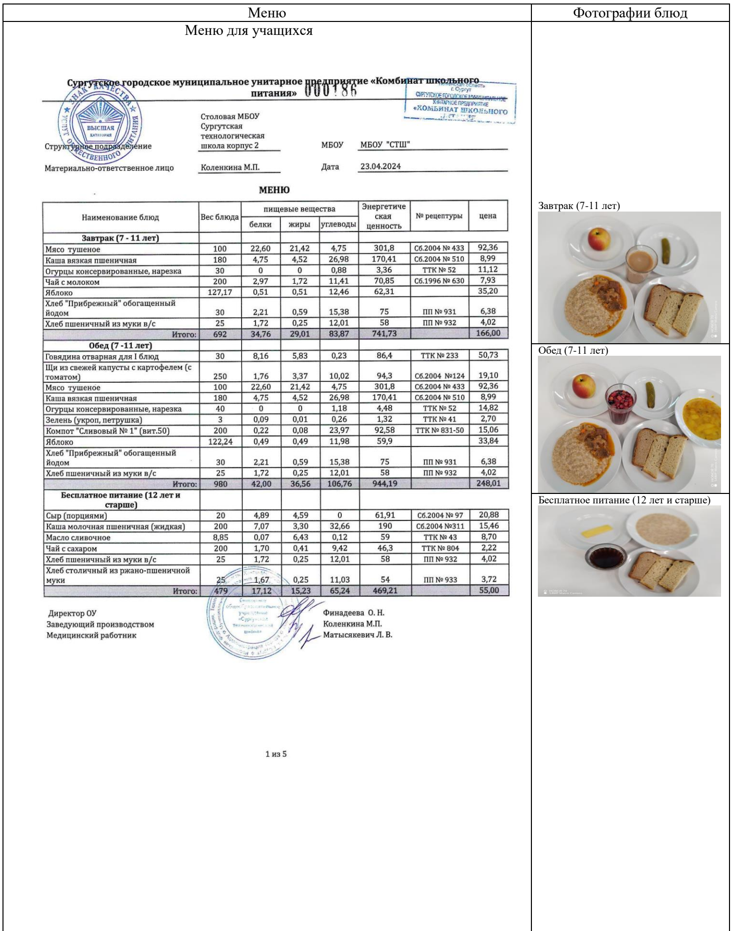
Завтрак (7-11 лет)