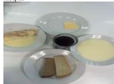
Льготное питание 1 смена (7-11 лет) обед