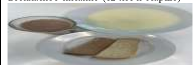
Завтрак (12 лет и старше)