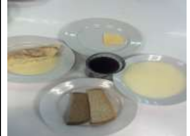
Обед (7-11 лет)