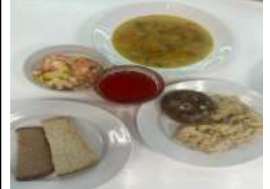
СД Льготное питание 2 смена (7-11 лет) обед