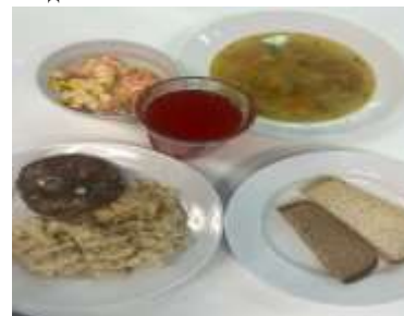
Льготное питание 2 смена (7-11 лет) обед