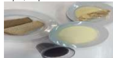
Льготное питание 1 смена (12 лет и старше) обед