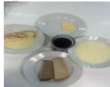
Льготное питание 1 смена (12 лет и старше) завтрак