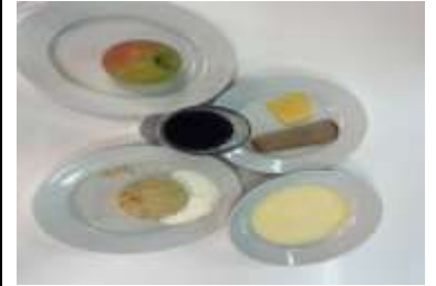
СД Льготное питание 1 смена (7-11 лет) обед