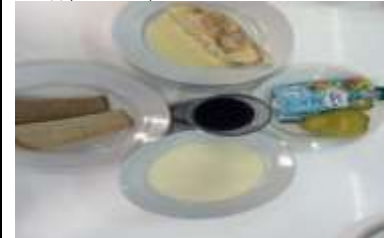
Бесплатное питание (12 лет и старше)