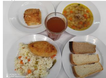
Льготное питание 2 смена (7-11 лет) обед