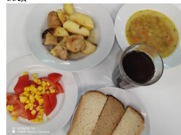
СД Льготное питание 2 смена (7-11 лет) полдник