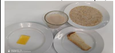
Завтрак (12 лет и старше)