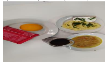
Целиакия обед 2 смена (7-11 лет)