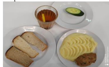
Льготное питание I смена (7-11 лет) обед