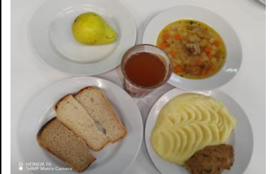
Бесплатное питание (12 лет и старше)