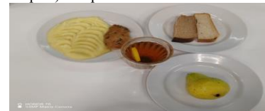
СД Льготное питание 1 смена (12 лет и старше) обед