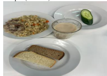
Обед (7-11 лет)