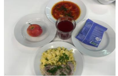
Целиакия обед 2 смена (7-11 лет)