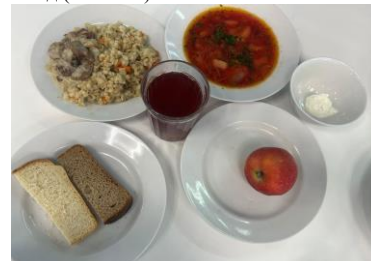
Бесплатное питание (12 лет и старше)