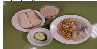
СД Льготное питание 1 смена (12 лет и старше) завтрак