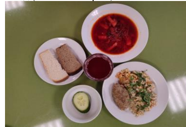
Бесплатное питание (12 лет и старше)