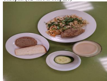
Обед (12 лет и старше)