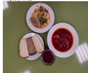
Льготное питание 2 смена (12 лет и старше), обед