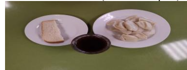
Льготное питание I смена (12 лет и старше) завтрак