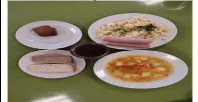
Бесплатное питание (12 лет и старше)