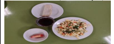
Льготное питание I смена (12 лет и старше) завтрак