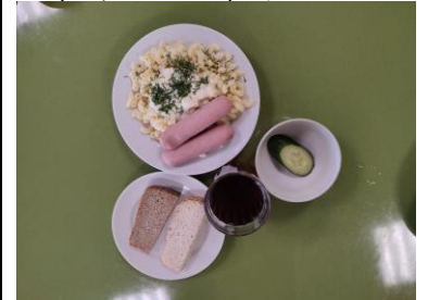
Обед (12 лет и старше)