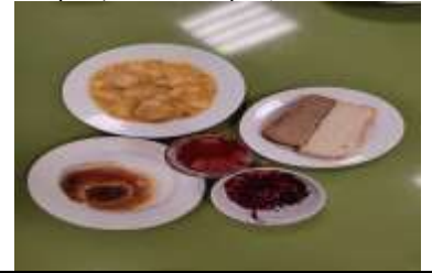
Обед (12 лет и старше)