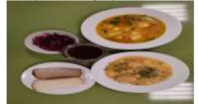
Бесплатное питание (12 лет и старше)