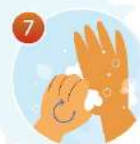
7 Потрите большие пальцы