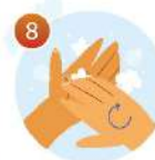
8 Потрите под ногтями