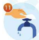
11 Закройте кран с помощью одноразовой салфетки