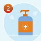
2 Нанесите мыло Продолжительность намыливания 20 секунд