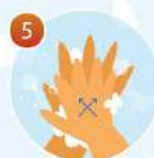
5 Потрите между пальцами, сложив ладони