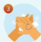
3 Вспеньте мыло