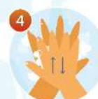
4 Потрите тыльные стороны ладоней