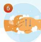
6 Потрите пальцы, сложив руки в замок