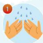
1 Намочите руки