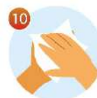
10 Вытрите руки бумажным или личным полотенцем насухо