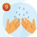
9 Смойте мыло