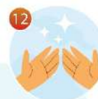
12 Теперь ваши руки чистые!