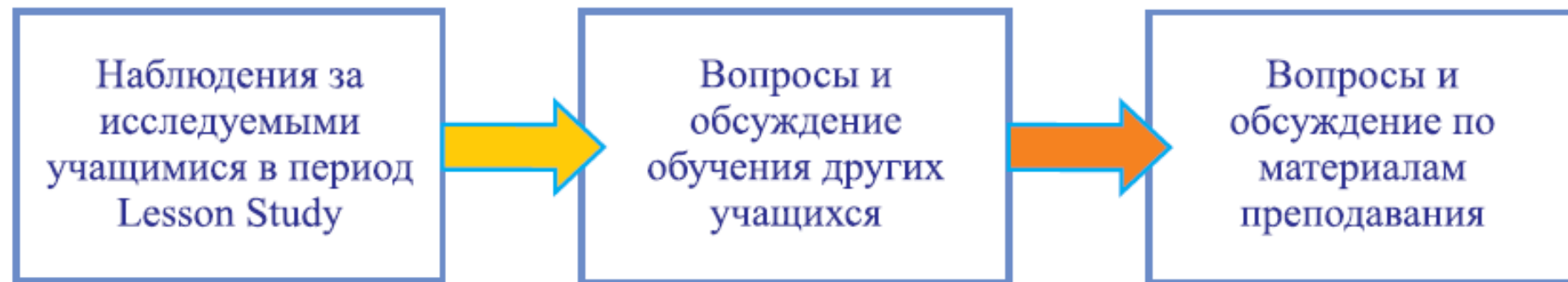
Рис. 3. Схема обсуждения по завершении Lesson Study