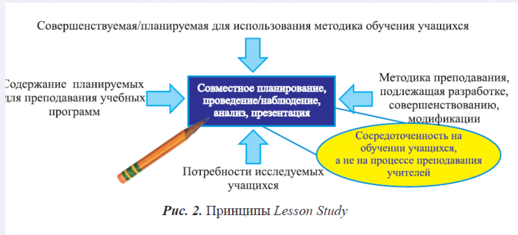
Рис. 2. Принципы Lesson Study